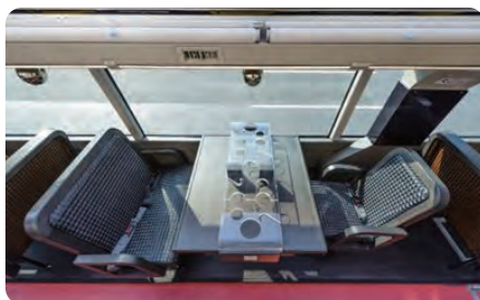
3名席テーブル(イメージ)