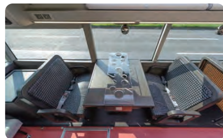
4名席テーブル(イメージ)