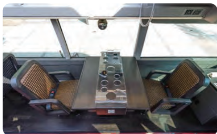
2名席テーブル(イメージ)